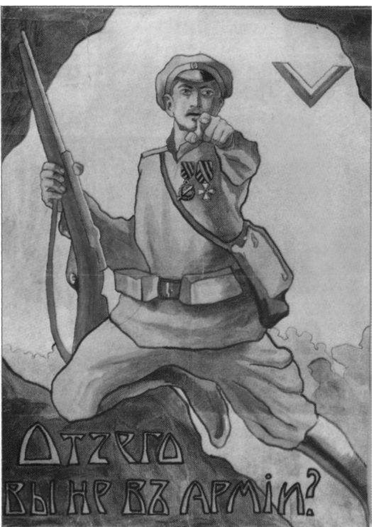
Белогвардейский плакат времен Гражданской войны.

... Сметая красные отряды, В мечте лелея Петроград, - Мы шли, не ведая пощады, Не зная окрика «назад»!