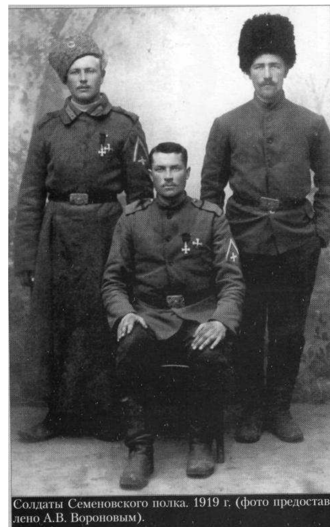
Солдаты Семеновского полка. 1919 г.

Кренгольм (Нарва) 14 декабря 1928 года Б. С-ов