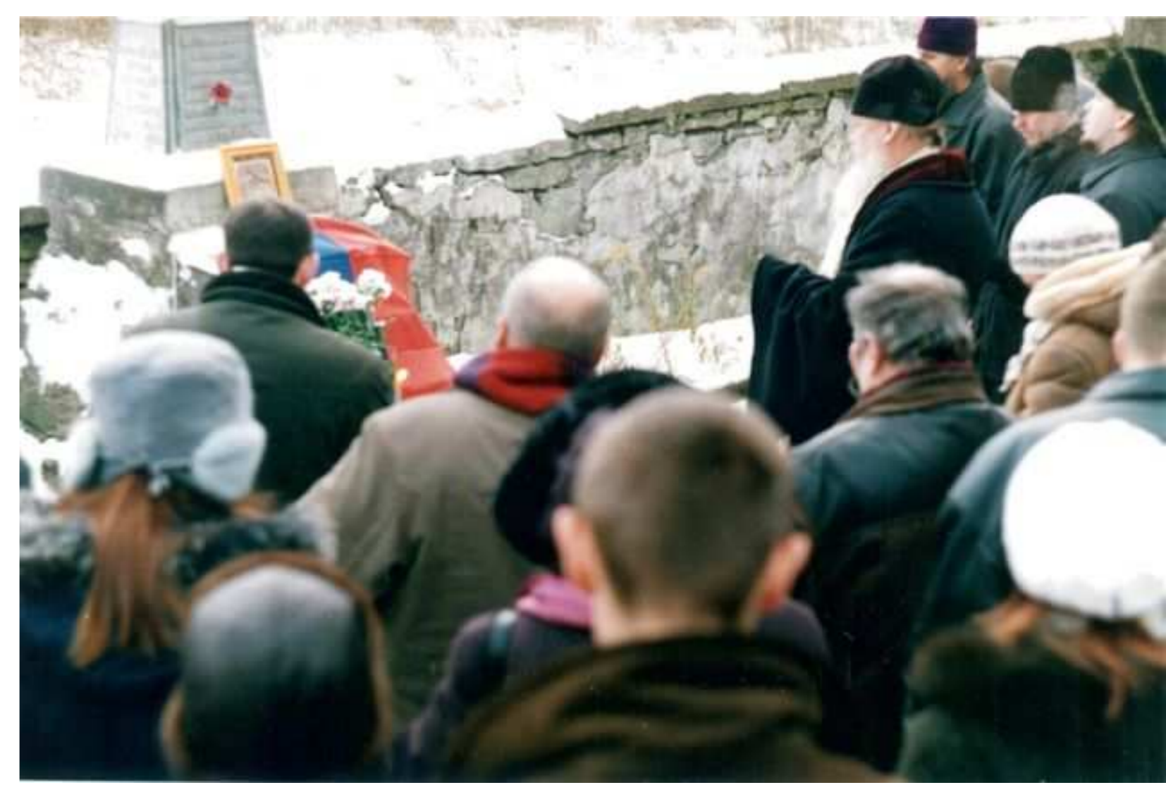
Панихида на братских могилах воинов СЗА на Ивангородском кладбище. Группа паломников студентов и преподавателей из Института Богословия (СПб) с братьями Михаило-Архангельского братства. 28 Ноября 2004 г.

Журналист, присутствовавший на одном из многочисленных похорон в Нарве, вспоминал: «Неохотно, молчаливо копают они яму, братскую могилу. Тут же на проезжей дороге лежат трупы один на другом, вверх лицом и вниз лицом. Разорванные носки, ужасная грязь, полуголые тела. Молодые и старые лица. Яма готова. Подтаскивают и сбрасывают тела. Тяжело падают они одно на другое. Громко считают гробокопатели. Они ведь получают по-штучно. Раз, два... 54. Это последний, молодой красивый солдат. Он не хочет в могилу. Как будто угрожая, поднимает руки из горы трупов... Уже многие недели копают каждый день гробокопатели. Каждый день роют новую могилу героям».