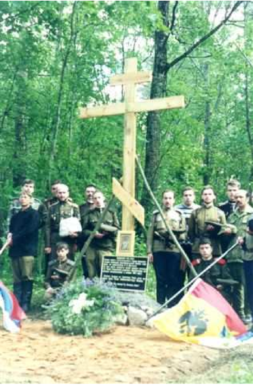
Урочище Свиноежа 24 июня 1998 года. Воздвижение Креста-Памятника. Начало Крестного Марша.