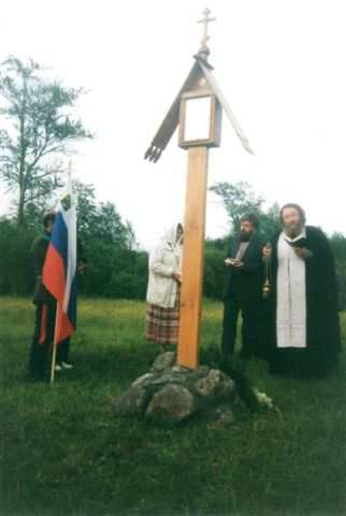
Воздвижение Русского Северного голубца с иконой Собор Святых Новомучеников Российских от безбожников убиенных на берегу реки Нарова близ села Скамья 22 июня 1999 года.