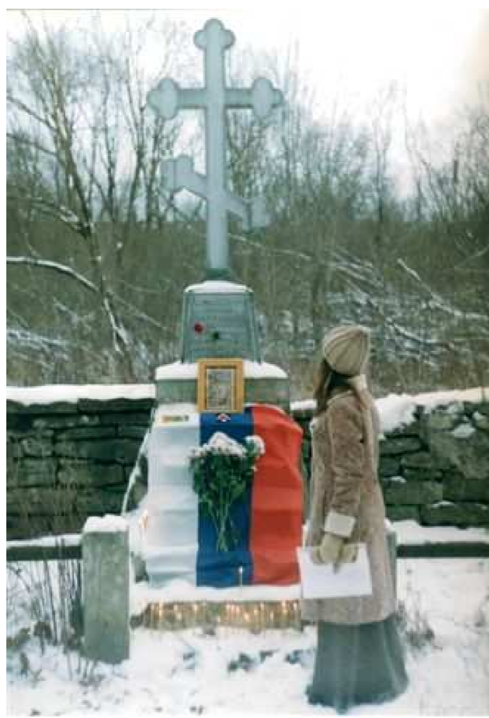
Панихида на братских могилах воинов СЗА на Ивангородском кладбище. Группа паломников студентов и преподавателей из Института Богословия (СПб) с братьями Михаило-Архангельского братства. 28 Ноября 2004 г.

Воинское Братство во имя Святого Архистратига Божия Михаила создано в 1996 году. Главная цель Братства – поиск и спасение уничтоженных в советское время захоронений воинов Армии генералов Н.Н. Юденича и А.П. Родзянко на Северо-Западе России. 24 июня 1998 года братством начат бессрочный Крестный Марш, целью которого является поиск и восстановление могил воинов Армии Белых фронтов на территории России. В ходе Крестного Марша найдено 41 захоронение воинов Северо-Западной Армии на территории России и 15 захоронений на территории Эстонии обнаружены Обществом охраны памятников Русской культуры. Найдены захоронения находящиеся в Ивангороде, селе Ложголово, Красном Селе, Гатчине, селе Ополье, деревнях Липа, Мануйлово, Фалилеево, Кикерино, Онтолово, Туганицы, Вруда и др.