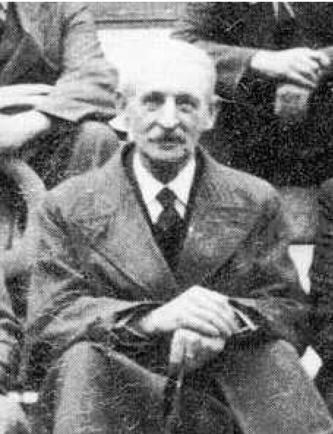
Генерал Арсеньев в эмиграции (30-е годы).